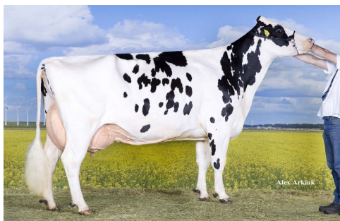
Giessen Shottle CINDERELLA 15

4 MADRE Scientific CINDERELLA MB 88 5 MADRE C Hanoverhill TONY RAE EX 96 6 MADRE C Hanoverhill TT ROXETTE EX 94 7 MADRE Mir r Mor ROXETTE EX 90 8 MADRE C Glenridge Citation ROXY EX 97 La Reina de la Raza 9 MADRE Norton Court Model VEE EX 90